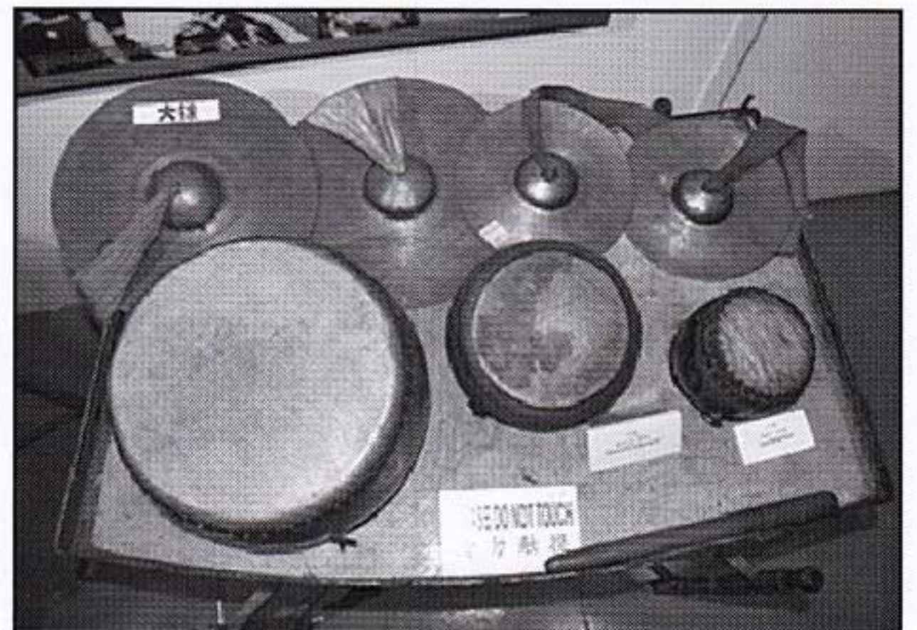
左上起：大钹、小钹。 左下起：大鼓、中鼓、小鼓。

为配合颍川陈氏公会成立70周年庆典，儒乐团将于6月25日晚在新山陈旭年文化街举办的“颍川之夜”，为大众带来三首儒乐曲及折子戏《正月点灯笼》的演出，切勿错过。